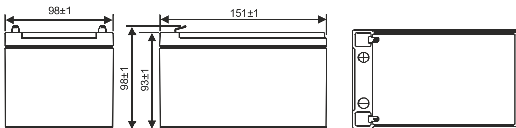
F2 (FASTON TAB 250)