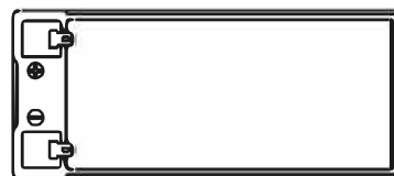
F2 (FASTON TAB 250)