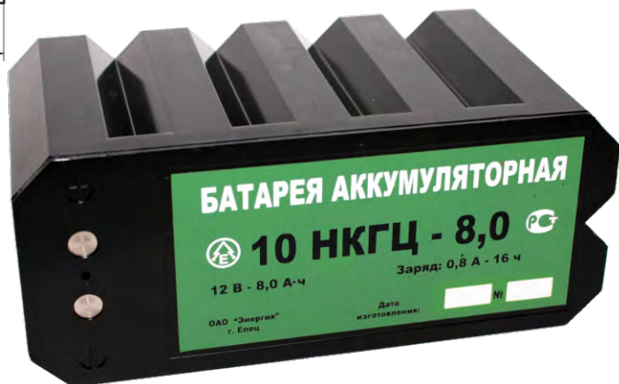
Технические характеристики аккумуляторной батареи 10НКГЦ-8,0