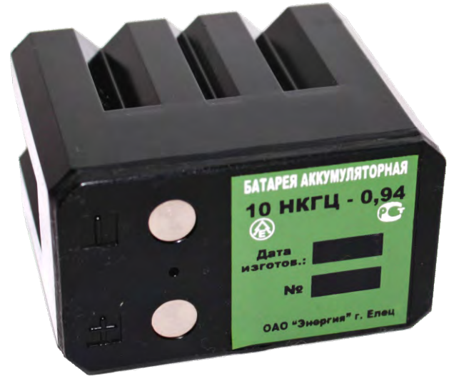
Технические характеристики аккумуляторной батареи 10НKGЦ-0,94